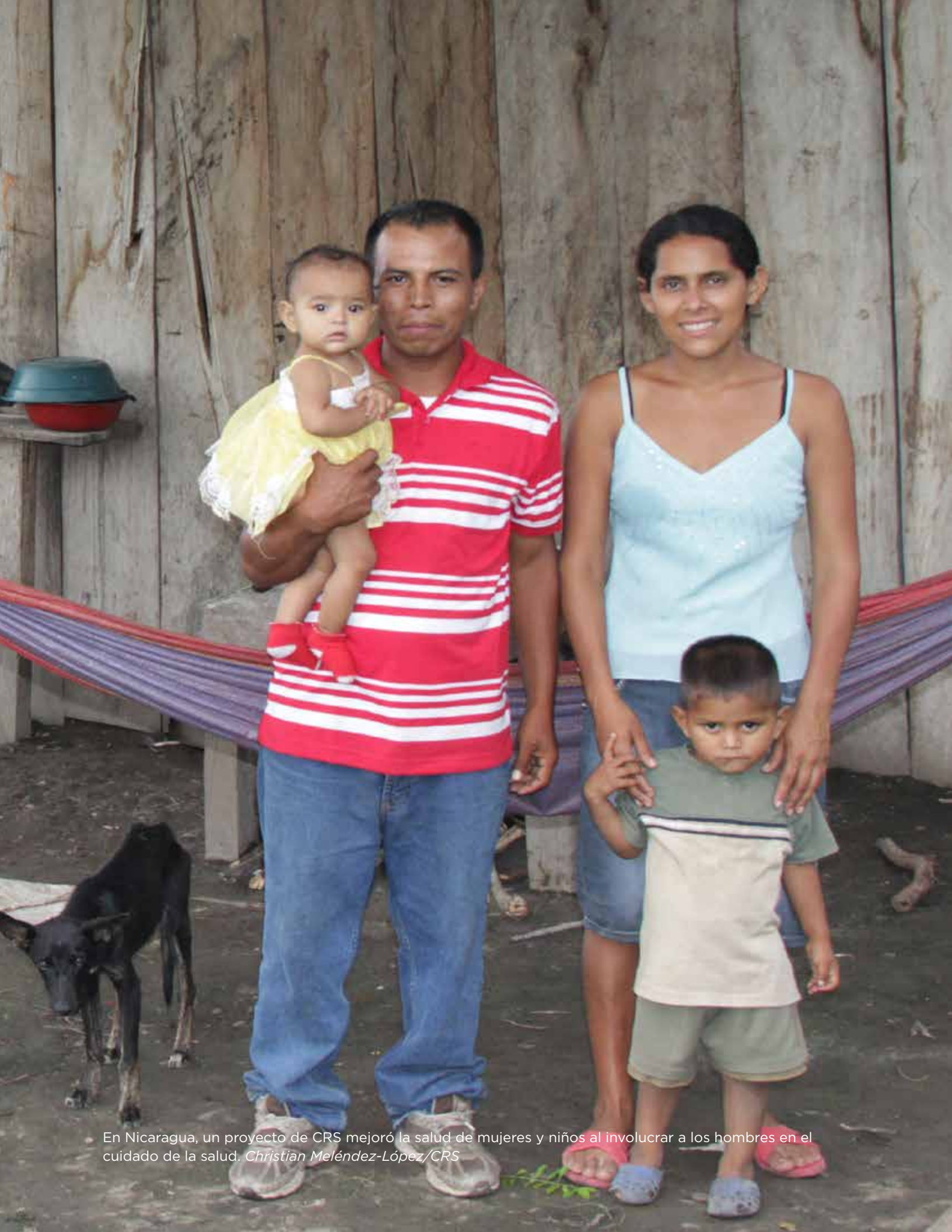
En Nicaragua, un proyecto de CRS mejoró la salud de mujeres y niños al involucrar a los hombres en el cuidado de la salud.