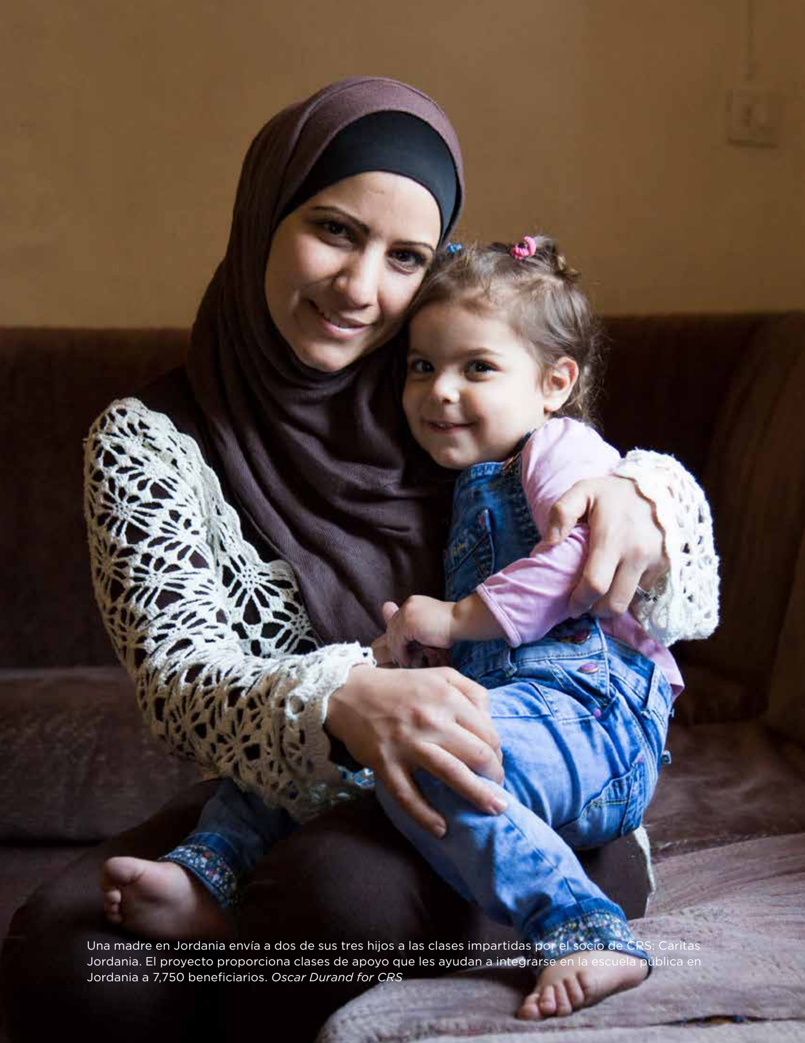
Una madre en Jordania envía a dos de sus tres hijos a las clases impartidas por el socio de CRS: Caritas Jordania. El proyecto proporciona clases de apoyo que les ayudan a integrarse en la escuela pública en Jordania a 7,750 beneficiarios.