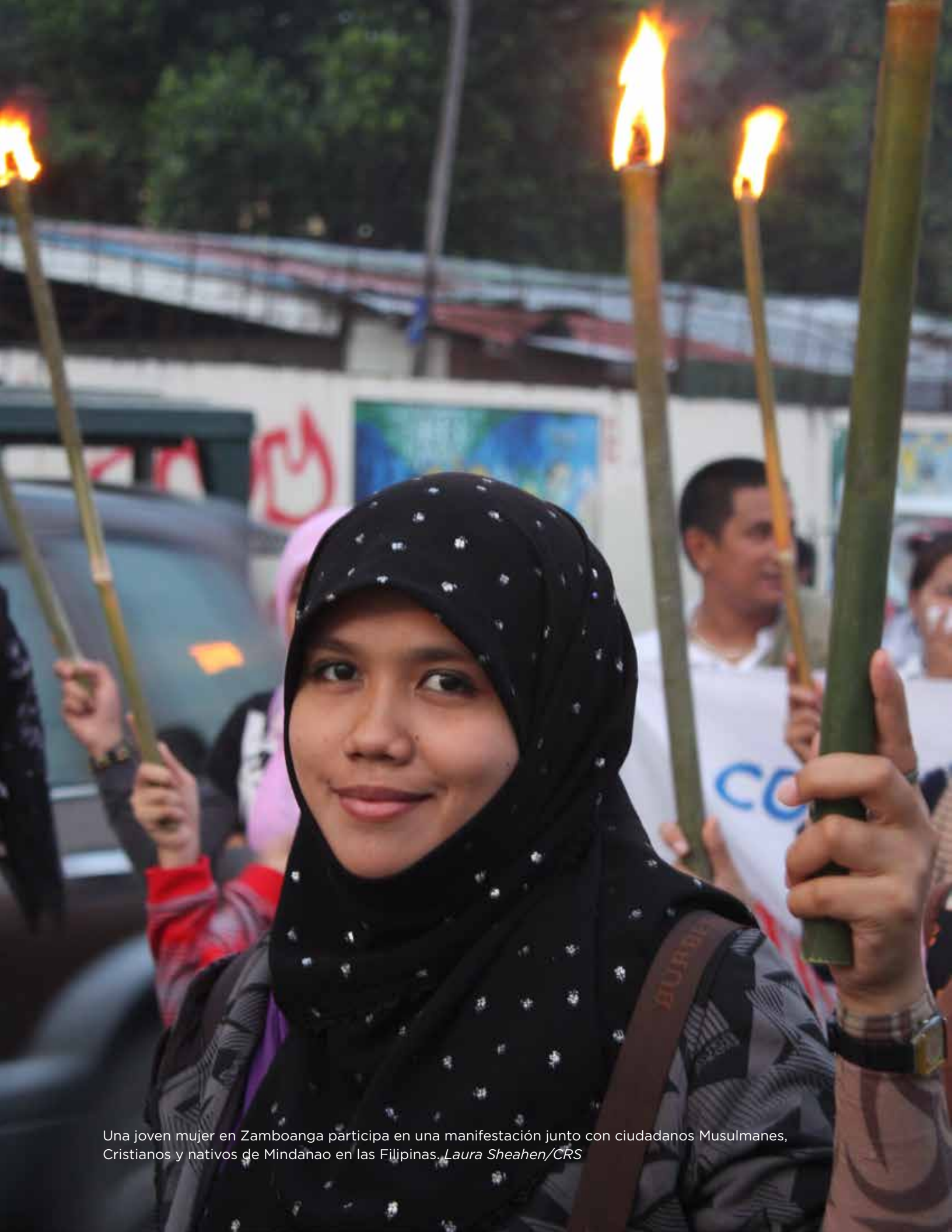
Una joven mujer en Zamboanga participa en una manifestación junto con ciudadanos Musulmanes, Cristianos y nativos de Mindanao en las Filipinas.