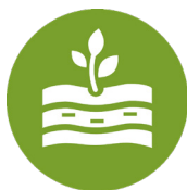
Stabilisation de dune