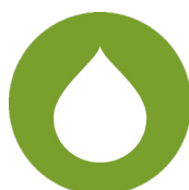
Restauration de grands bassins versants (Protection de source)