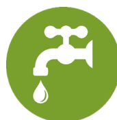
Construction de forages