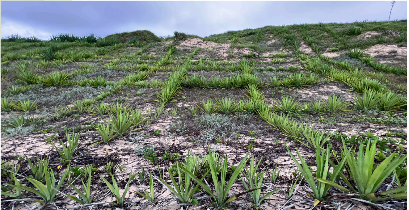
Stabilisation de neuf hectares de dune avec des jeunes plants de sisal et de lalande sur le site Afondralambo, commune de Anjampaly, district de Tsihombe, région Androy, Photo prise par Miguel Rasolofo/CRS