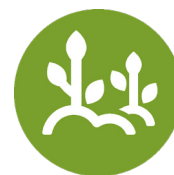
Mise en place et opérationnalisation de pépinières