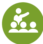
Campagnes de sensibilisation