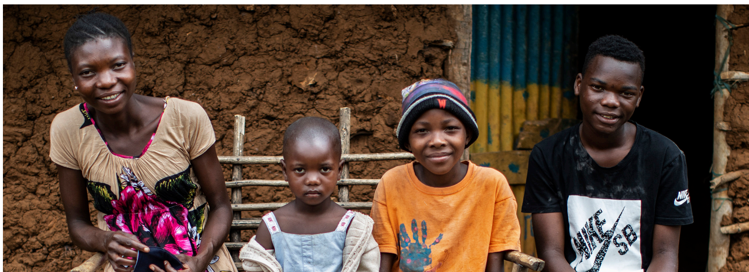
En 2020, debido al COVID-19, el gobierno ordenó a las instituciones de cuidado infantil de Kenia que regresaran a sus familias a los niños que tuvieran parientes vivos. La familia en la foto recibe el apoyo de Changing the Way We Care . SM