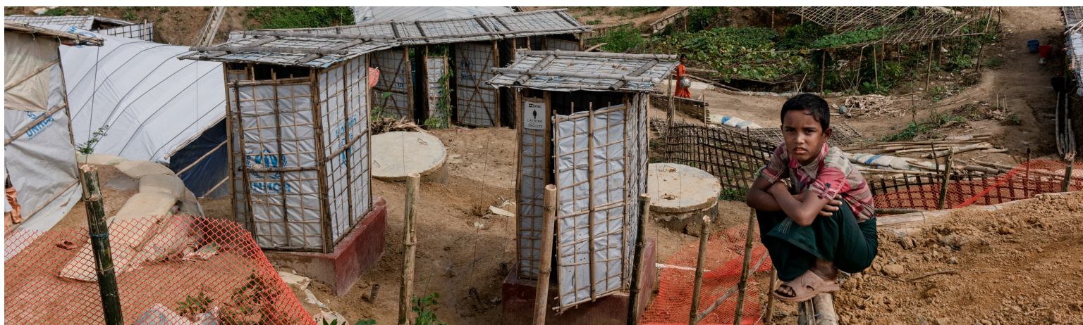
CRS está ayudando a Caritas Bangladesh a proporcionar apoyo integral a los refugiados rohingya.